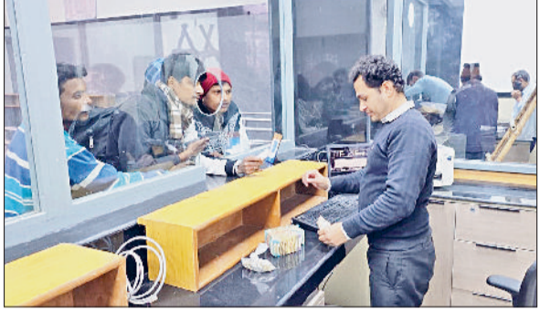
सोनीपत। बुकिंग कार्यालय की विंडो पर टिकट खरीदते यात्री।

रेलवे ने यात्रियों के बैठने के लिए बैच लगाए