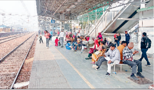
सोनीपत स्टेशन के प्लेटफार्म नंबर 1 पर ट्रेन का इंतजार करते यात्री।

सोनीपत स्टेशन से रोजाना दिल्ली-अंबाला रूट पर करीब 40 हजार यात्री आवागमन करते हैं। एक दशक में रेल यात्रियों की संख्या में करीब 40 फीसदी तक इजाफा हुआ है, यात्रियों की सुविधा के लिए किए जा रहे हैं सौंदर्यीकरण के कई कार्य