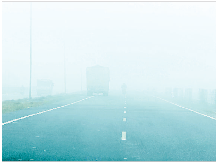
सोनीपत। गोहाना बाईपास पर सुबह के समय छाया कोहरा।

गया, जिससे सड़कों पर दृश्यता काफी कम हो गई। कई स्थानों पर वाहन चालकों को हेडलाइट और फॉग लाइट का सहारा लेना पड़ा। हाईवे और प्रमुख सड़कों पर रफ्तार धीमी रही। कोहरे के कारण कुछ देर के लिए यातायात भी प्रभावित हुआ। हालांकि किसी बड़े हादसे की सूचना नहीं मिली। सुबह करीब 11 बजे के बाद कोहरा धीरे-धीरे छंटना शुरू हुआ और धूप निकलने से लोगों को कुछ राहत मिली। धूप निकलते ही बाजारों और सार्वजनिक स्थानों पर लोगों की आवाजाही बढ़ी। हालांकि ठंडी हवा चलने के कारण दिन भर ठंड का अहसास बना रहा। दिन के समय करीब पांच किलोमीटर प्रति घंटा की रफ्तार से हवा चलती रही, जिससे तापमान में खास बढ़ोतरी नहीं हो सकी।