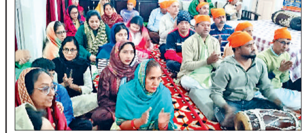
सोनीपत के श्री सनातन धर्म सांभर, गीता भवन में सुंदरकांड पाठ करते श्रद्धालु।