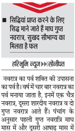
हरिभूमि न्यूज | सोनीपत