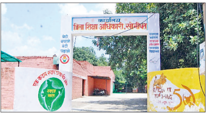
सोनीपत। सोनीपत के सेक्टर-14 स्थित जिला शिक्षा विभाग का कार्यालय।

23 जनवरी को कक्षा 10वीं की होने वाली हिंदी विषय की परीक्षा अब 31 जनवरी को ली जाएगी। इसके अलावा इसी दिन निर्धारित कक्षा 12वीं की विभिन्न विषयों पर परीक्षा अब 5 फरवरी को करवाने के निर्देश दिए गए